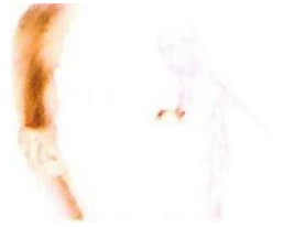
ホワイトニングパック