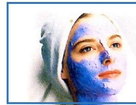
パック・ゴマージュ・AHA