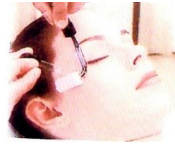
高濃度ビタミンC 導入