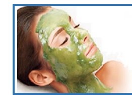
海藻・パラフィン・石膏・ピールオフ